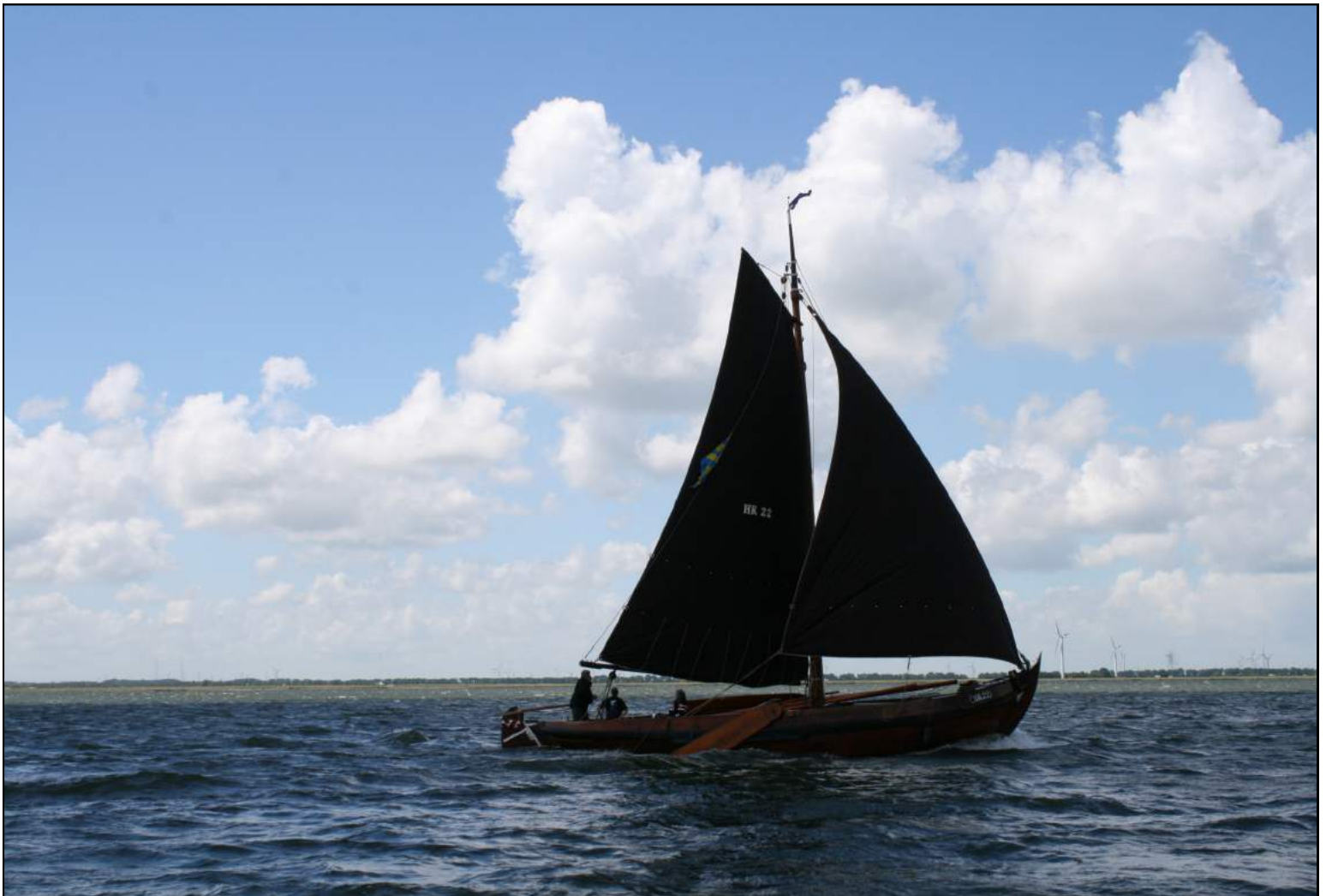
De HK 22 op het Wolderwijd, tijdens de bokkingrace in 2017.